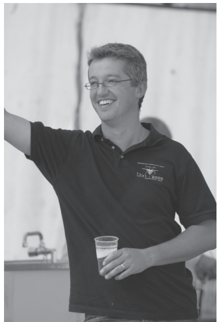
En dorstig weer dat het was!