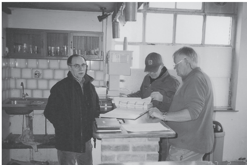
De inspecteurs van het DgL kijken de levensloopmappen na...