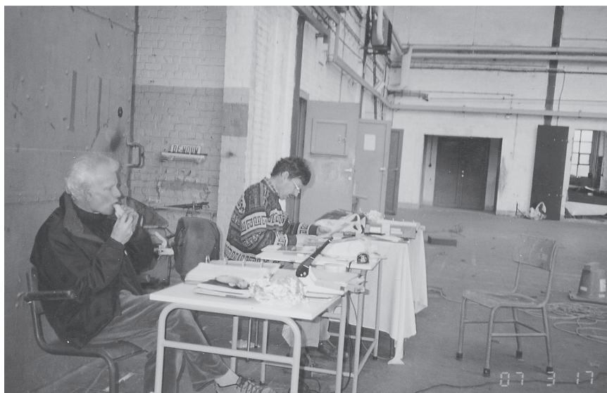
Voorbereiding van de toestellen voor de keuring

Elke club en privé eigenaar moet beschikken over een "LEVENSLIOP MAP" van zijn toestel, toestellen. Deze inhoud moet alle technische fiches betreffende onderhoud, uitgevoerde TM,s, reparaties, instrumentatie, weegplan, technische keuring enz. bevatten.