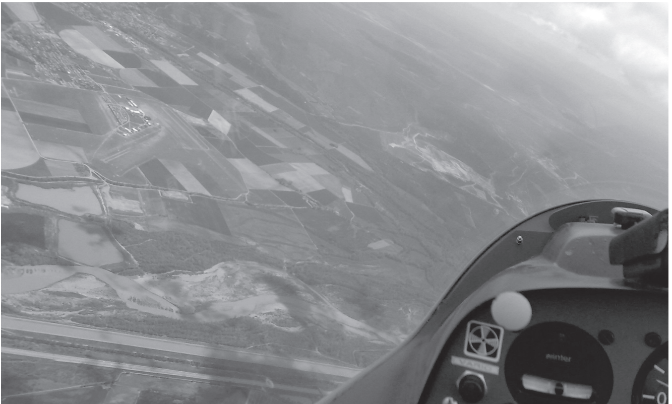
Het vliegveld van Vinon vanuit de lucht.