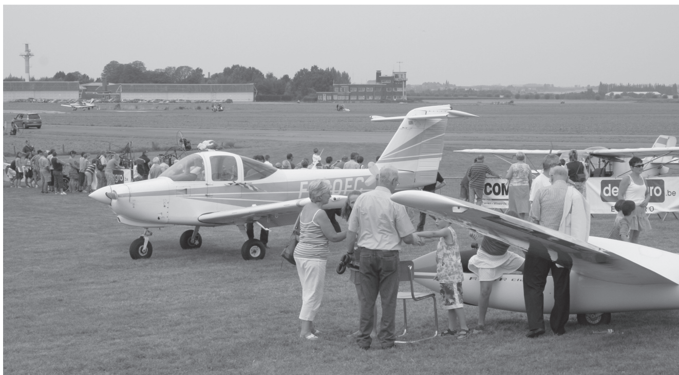
De static show wekte veel interesse bij de bezoekers...