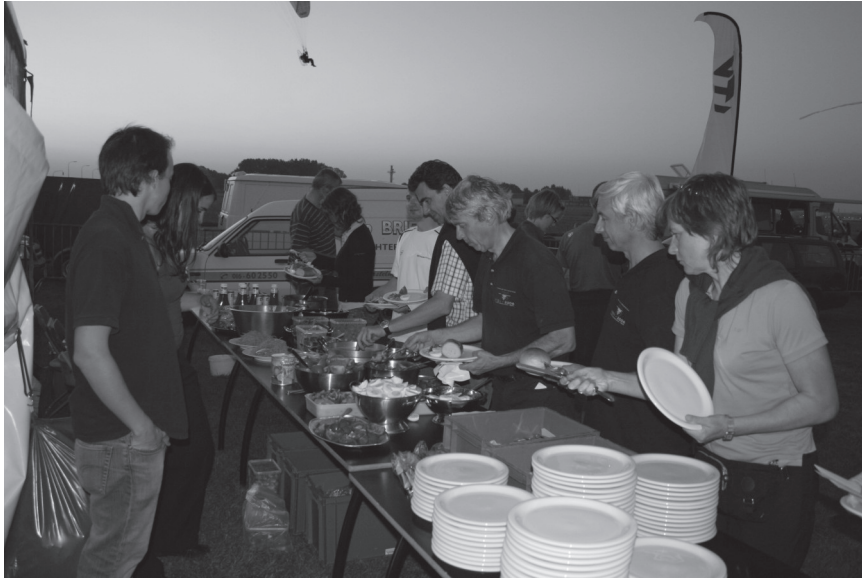
Aanschuiven voor de BBQ