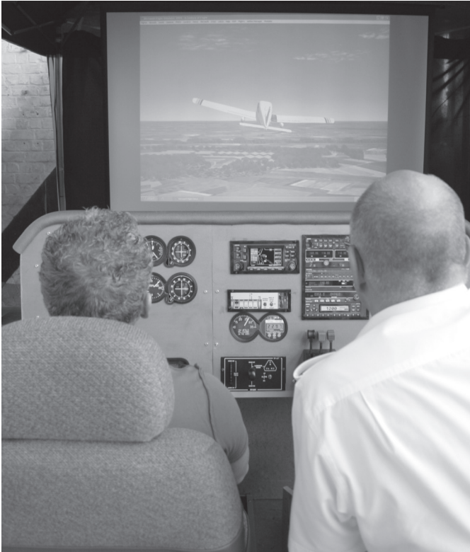
De stand van de Flight Simulator Club Belgium