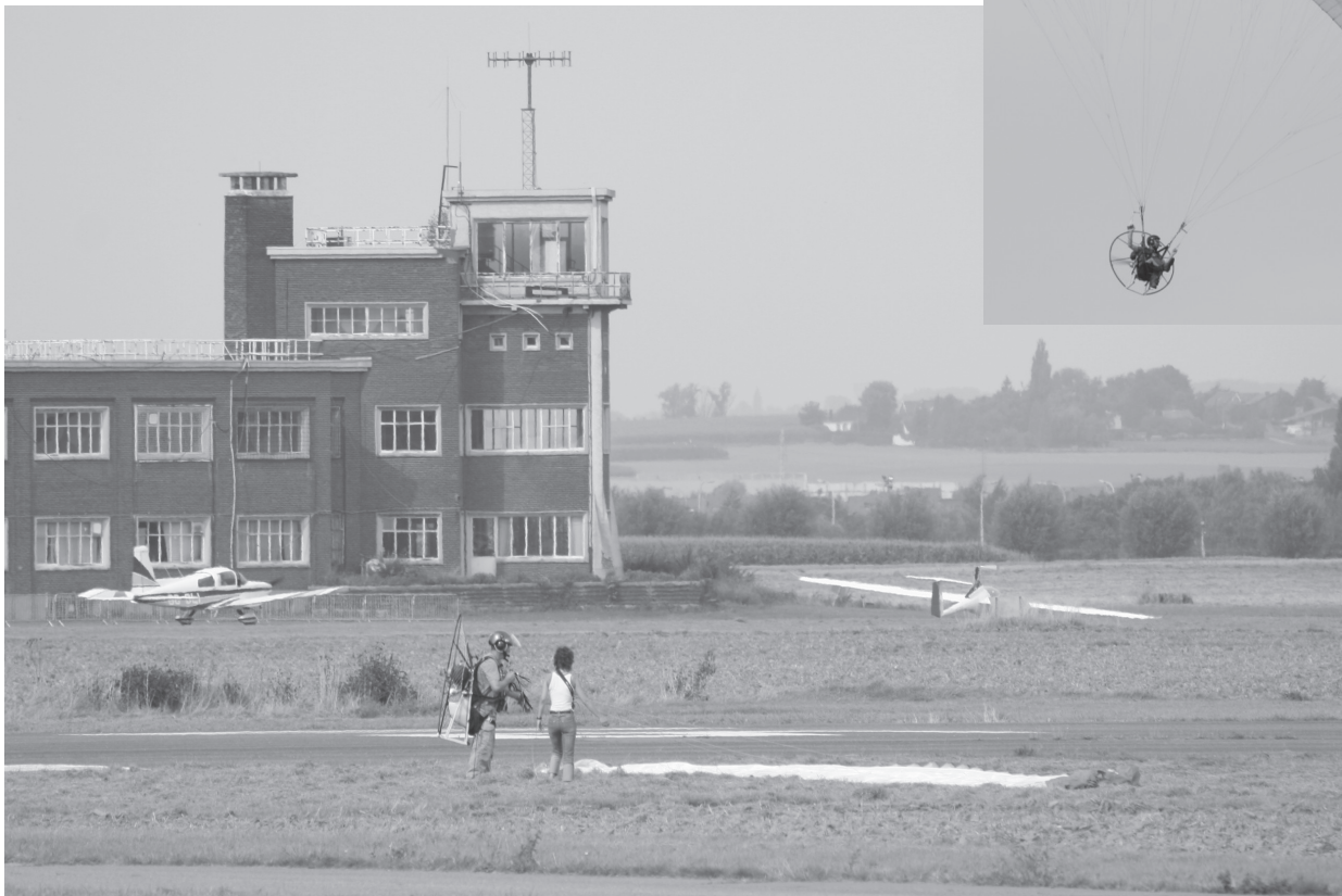
De parapentes zorgden opnieuw voor het nodige spektakel