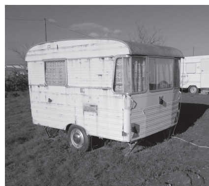
Eén van de caravans die je kan huren... Er zijn gelukkig ook grotere modellen beschikbaar!

Neem dan met mij contact op ( johan.vanhoyland1@telenet.be ). Twijfel je nog, neem dan eens een kijkje op de site van de club van Vinon ( www.vinon-soaring.fr ). Hier vind je allerhande gedetailleerde info om je helemaal over de streep te trekken. Of... informeer een keer bij Theo. Hoe meer zielen, hoe meer vreugde !