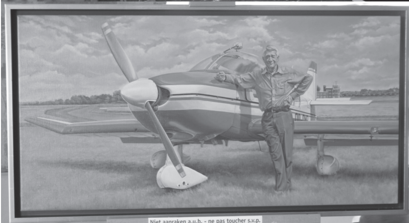
De expo over het clubleven...