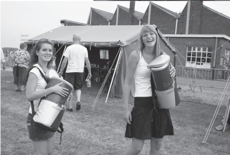
Het 'schoon volk' van Red Bull