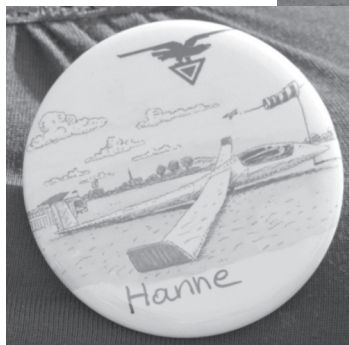
Koen mocht de hele dag vliegtuigjes en buttons knutselen